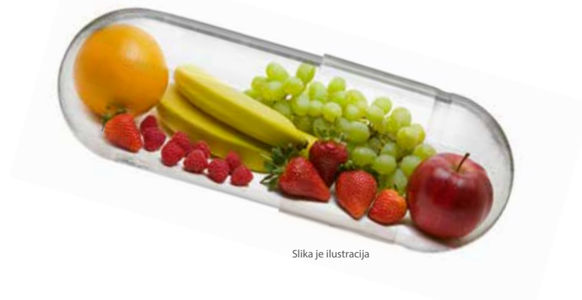
Slika je ilustracija