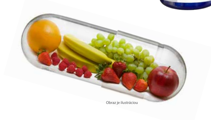
Obraz je ilustráciou