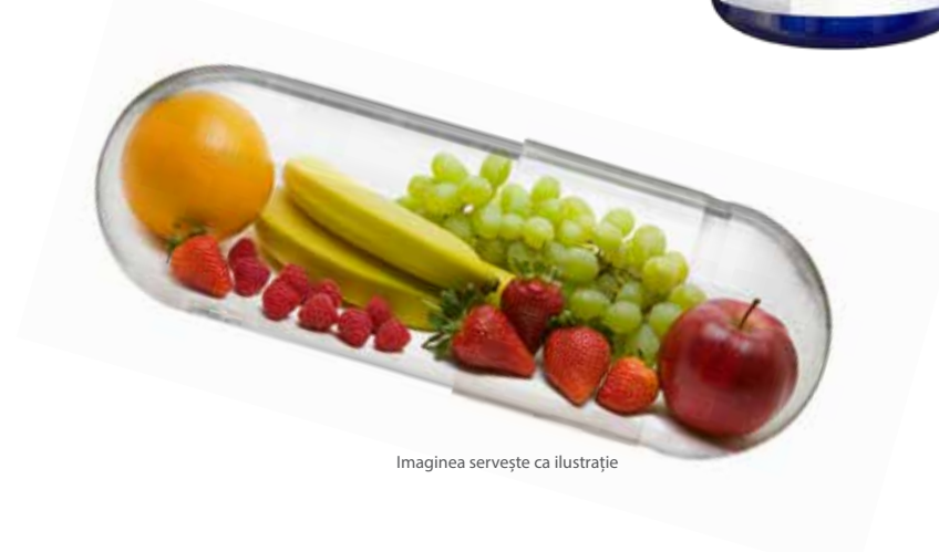
Imaginea servește ca ilustrație