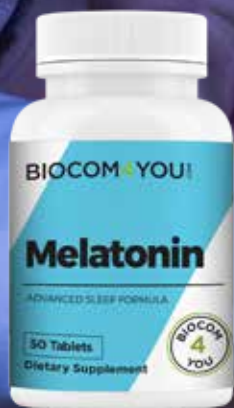
Melatonin 3mg 50 db tableta

... csak 1958-ban tudták izolálni azt a titokzatos vegyületet, amit a tobozmirigy termel? Melatoninnak nevezték el. (A melas görög szó feketét jelent, utalva arra, hogy ez a hormon kizárólag sötétben, a sötétség hatására termelődik az élő szervezetekben.) A melatoninszint jelentős napszaki ingadozást mutat, emberekben éjjel tízszer magasabb, mint nappal, s fontos szerepet játszik az alvás-ébrenlét szabályozásában.