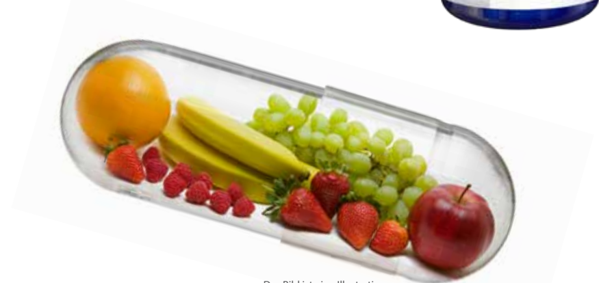
Das Bild ist eine Illustration